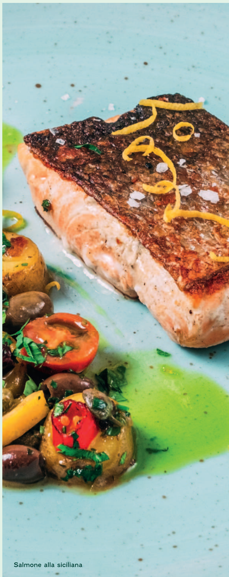
Salmone alla siciliana