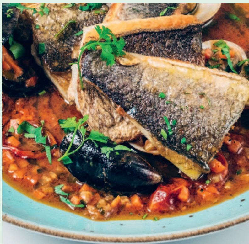
Filetto di orata in guazzetto

opečená domácí houska, uzená majonéza, 100% hovzí, sýr taleggio, pancetta, cibulová marmeláda a rukola; doporučujeme steakové hranolky toasted homemade bun, smoked mayonnaise, 100% beef, taleggio cheese, pancetta, onion marmalade and arugula; recommended with steak fries (1, 3, 7, 11)