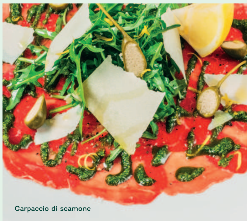
Carpaccio di scamone