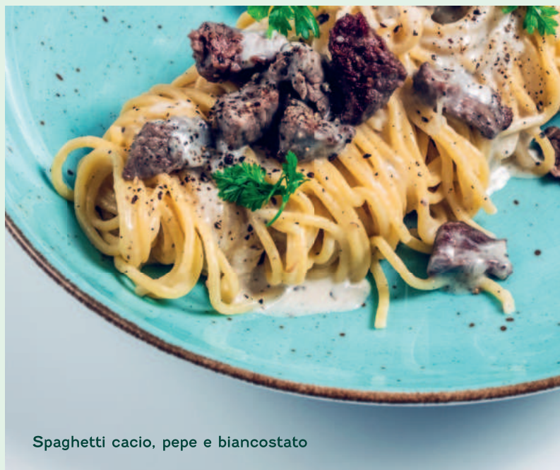
Spaghetti cacio, pepe e biancostato

Pasta senza glutine + 60,- bezlepkové penne gluten free penne