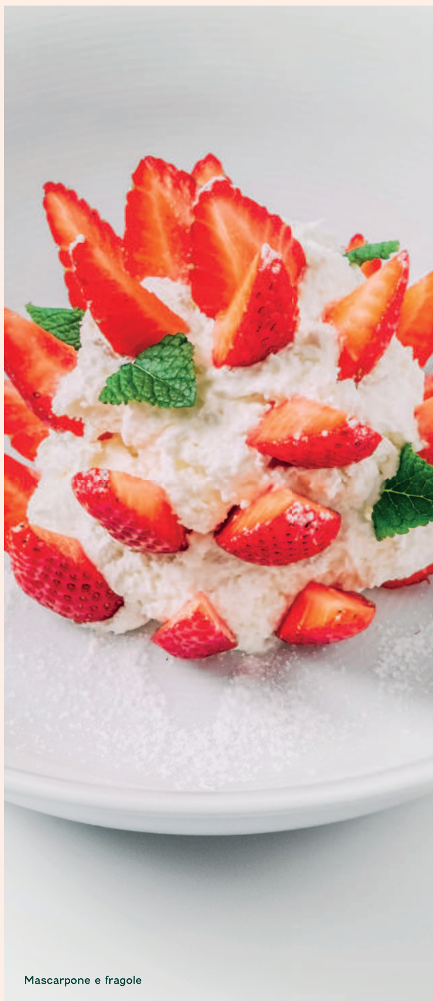
Mascarpone e fragole