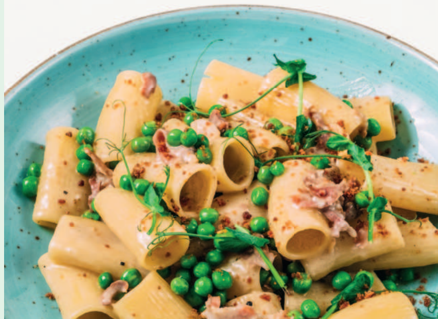
Rigatoni prosciutto crudo e piselli

084 Risotto con gamberetti 339,- NEW restované krevety, hráškově-špenátový krém s mátou, granátové jablko, pomerančová kůra, crumble z bílého chleba roasted shrimps, pea and spinach cream with mint, pomegranate, orange peel, white bread crumble (1, 2, 7)