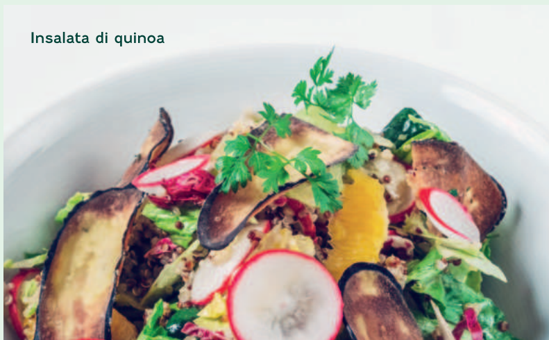
Insalata di quinoa

043 Insalatina di pomodori, olive e rucola 79,- rajčatový salátek s olivami a rukolou tomato salad with olives and arugula